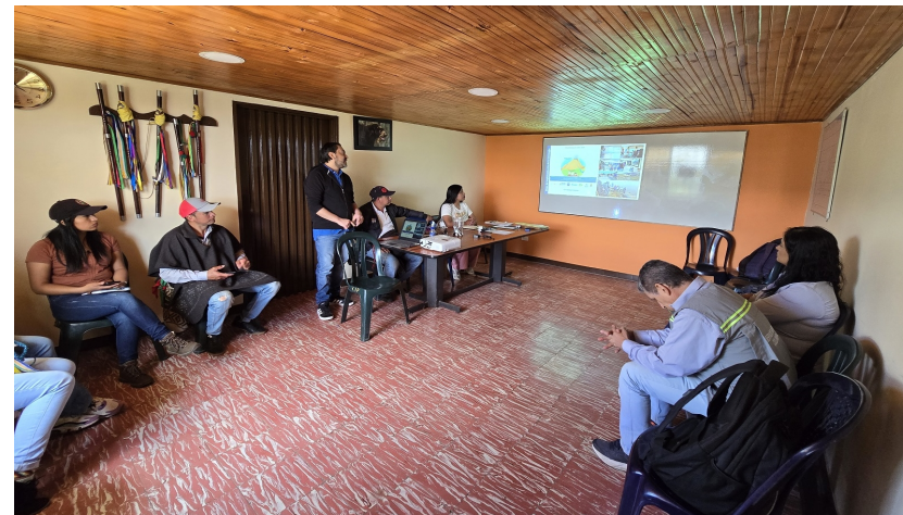
Imagen 2: Reunión de empalme con el Cabildo Indígena de Puracé